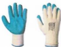
EN- 420, 2007

ქიმიური ხელთათმანები, უნდა აკმაყოფილებდეს EN 374, 2003 სტანდარტის მოთხოვნებს.