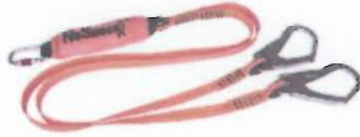
დამზღვევი ბაგირი ამორტიზატორითა და ორმაგი კაუჭით