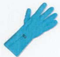
EN 374, 2003