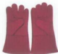
EN -407, 2004